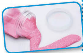
網上圖片只供參考