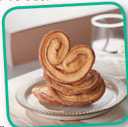
網上圖片只供參考

3. 活動涉及使用爐具及刀具，參加者必須跟隨導師指示及遵守秩序，違者會被暫停進行烘焙活動