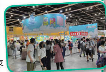
網上圖片只供參考