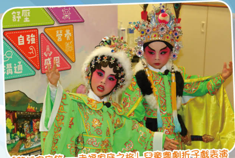
「龍城家庭節——幸福家庭之旅」兒童粵劇折子戲表演