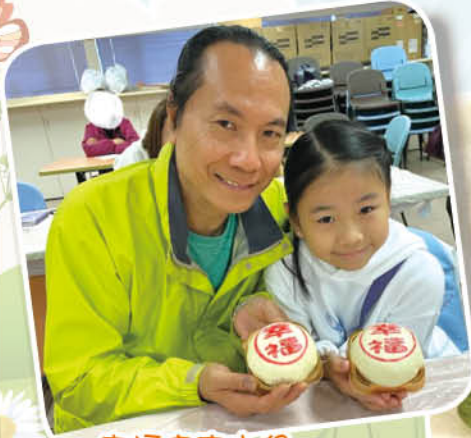
幸福家庭小組 幸福包製作