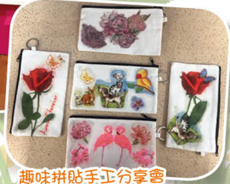
趣味拼貼手工分享會