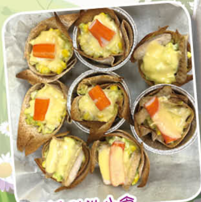
聖誕 Chill 小食