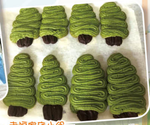
幸福家庭小組 聖誕樹曲奇餅製作