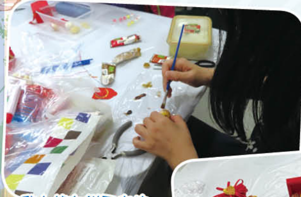
黏土嫁女餅工作坊