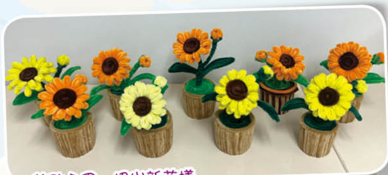
花點心思 - 扭出新花樣