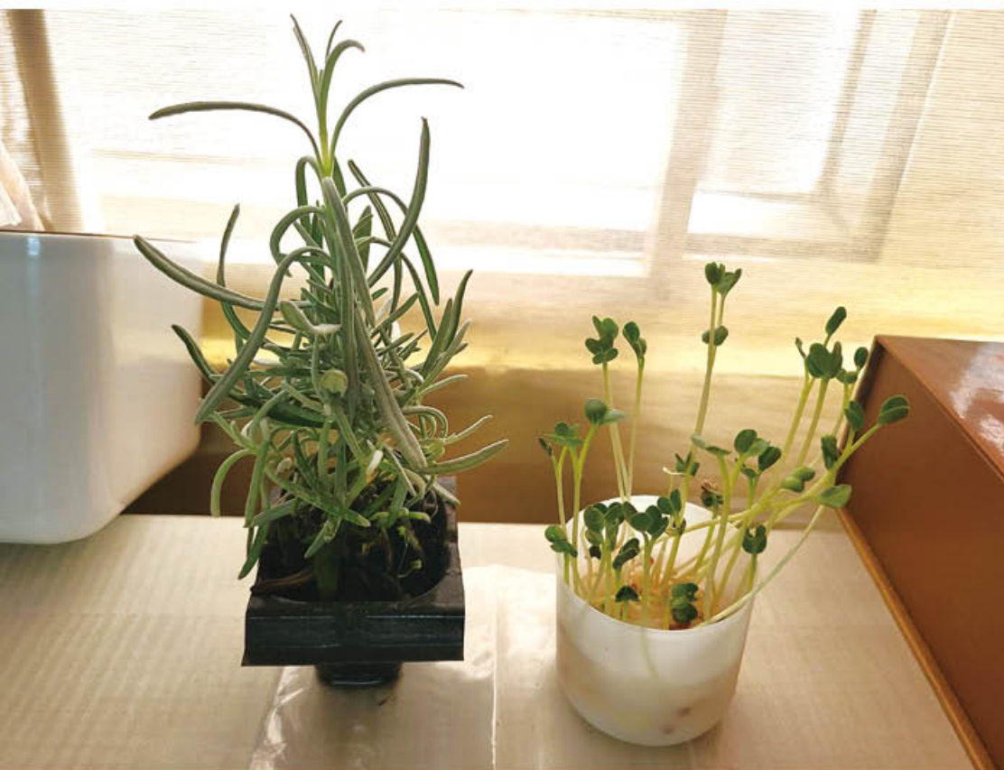
冬去春來夏又至，多謝中心舉辦的「心靈種子」活動，讓我在疫情期間平靜心靈，放鬆身心！