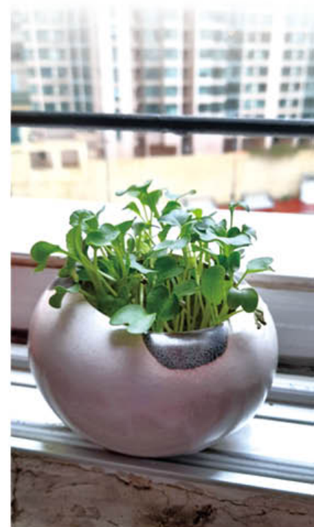
參加心靈種子水耕蔬菜體驗，好開心第一次種三天就見蘿蔔苗長出，好開心，好像見到BB出世一樣，好期待它長大～

方法總比困難多。所以社會福利署啓德綜合家庭服務中心和香港善導會龍澄坊的社工設法把大自