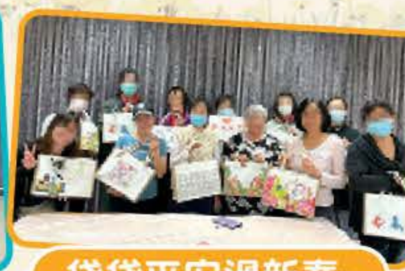
袋袋平安過新春- 蝶古巴特工作坊