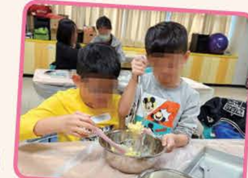
「冬日親子玩多FUN」 曲奇妙趣工作坊