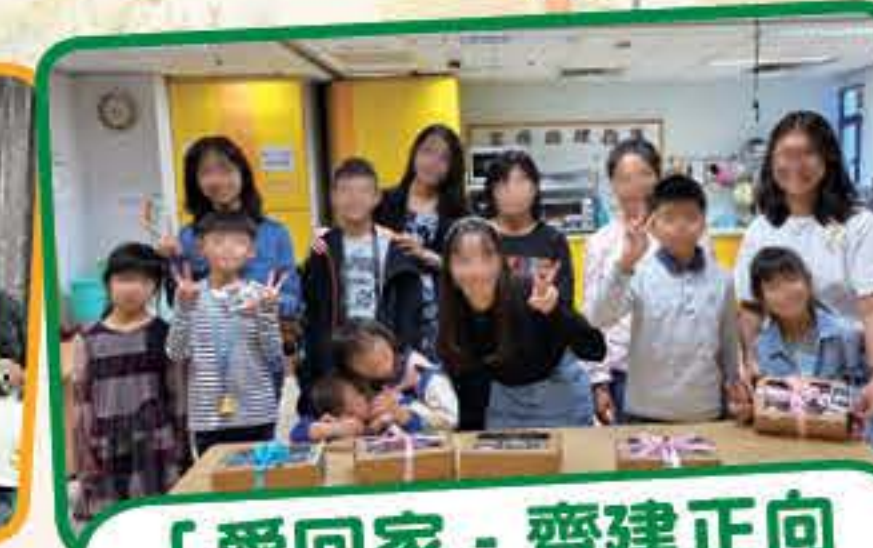
「愛回家 - 齊建正向 親子關係」家長小組