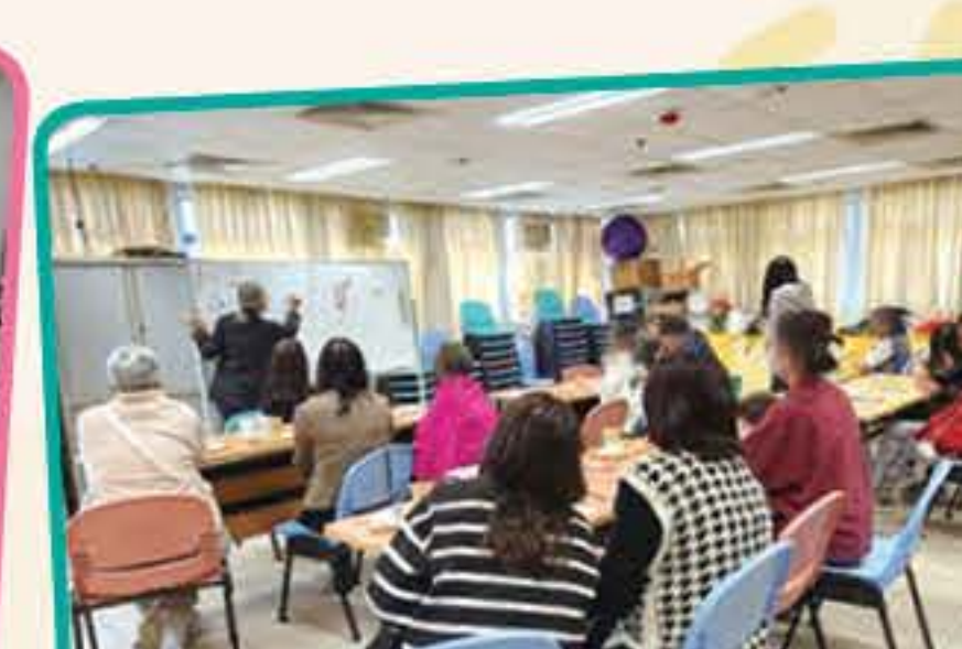
社區照顧者咖啡室