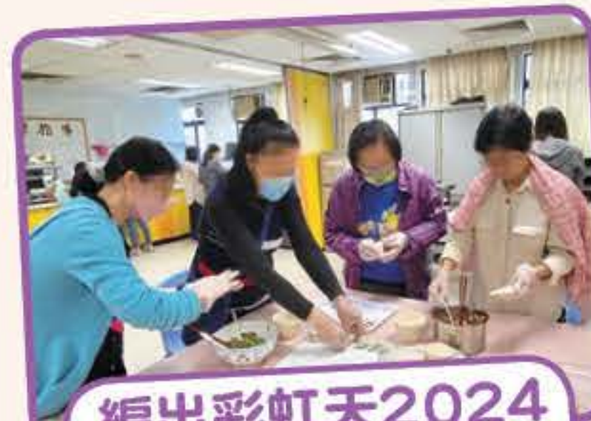
編出彩虹天2024 開年大吉