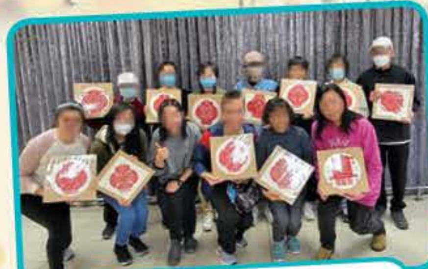
新年剪紙藝術體驗