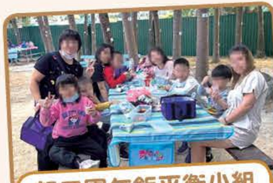
親子團年飯平衡小組