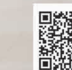
Tiếng Việt (Vietnamese)