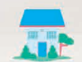
Trung tâm Hỗ trợ và Can thiệp Khủng hoảng Đa năng (Trung tâm Khủng hoảng CEASE)

Trung tâm Khủng hoảng CEASE do Tập đoàn Bệnh viện Tung Wah điều hành, cung cấp các dịch vụ hỗ trợ toàn diện cho các nạn nhân trưởng thành của bạo lực tình dục và các cá nhân/gia đình phải đối mặt với bạo lực gia đình hoặc các cuộc khủng hoảng khác. Các dịch vụ được cung cấp bao gồm đường dây nóng 24 giờ, dịch vụ can thiệp khủng hoảng/tiếp cận cộng đồng ngay lập tức cho các nạn nhân trưởng thành của bạo lực tình dục và người cao tuổi bị lạm dụng, và hỗ trợ thích hợp và chỗ ở ngắn hạn.