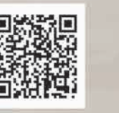
Tiếng Việt (Vietnamese)