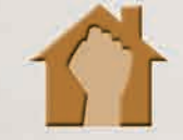
Chương trình Hỗ trợ Nạn nhân của Nạn nhân Bạo lực Gia đình

Được điều hành bởi SWD và các tổ chức phi chính phủ (NGO), các Trung Tâm Dịch Vụ Gia Đình Tích Hợp (IFSC)/các Trung Tâm Dịch Vụ Tích Hợp (ISC) nhằm hỗ trợ và cung cấp các cá nhân và gia đình thông qua việc cung cấp các dịch vụ phúc lợi với phương pháp tiếp cận lấy trẻ em làm trung tâm, tập trung vào gia đình và dựa vào cộng đồng. Hiện tại, có một mạng lưới rộng lớn gồm 67 IFSC/ISC trên khắp Hồng Kông cung cấp cho các cá nhân và gia đình có nhu cầu các dịch vụ khác nhau, bao gồm dịch vụ tư vấn, nguồn lực và thông tin dịch vụ, giáo dục đời sống gia đình, các hoạt động giữa cha mẹ và con cái, dịch vụ làm việc nhóm, các chương trình, đào tạo và dịch vụ tình nguyện, dịch vụ tiếp cận cộng đồng, dịch vụ tư vấn và dịch vụ giới thiệu, v.v.