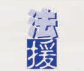
Bộ phận Trợ giúp Pháp lý

Trung tâm Po Leung Kuk Tsui Lam do SWD thành lập cung cấp thông tin, hỗ trợ tinh thần và dịch vụ đồng hành cho các nạn nhân của bạo lực gia đình (bao gồm lạm dụng vợ/chồng/người sống chung và lạm dụng trẻ em) để giảm bớt nỗi sợ hãi và bất lực của họ khi phải đối mặt với thủ tục tố tụng pháp lý hoặc thay đổi cuộc sống đột ngột.