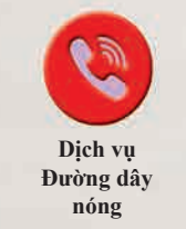
Dịch vụ Đường dây nóng

Bạn có thể sử dụng Bộ Phúc Lợi Xã Hội (SWD) Dịch vụ đường dây nóng 2343 2255 để nhận thông tin về các dịch vụ phúc lợi liên quan và nhận được lời khuyên/hỗ trợ kịp thời từ nhân viên xã hội. Nhân viên xã hội của Đường dây nóng SWD làm việc từ 9:00 sáng đến 5:00 chiều từ thứ Hai đến thứ Sáu, và từ 9:00 sáng đến 12:00 trưa vào thứ Bảy để tư vấn, hỗ trợ và đưa ra lời khuyên, đồng thời sắp xếp các dịch vụ theo dõi thích hợp cho những người có nhu cầu. Ngoài những giờ làm việc này (bao gồm cả ngày lễ), người gọi có thể chọn chuyên cuộc gọi của họ đến Đường dây nóng và Nhóm Dịch vụ Tiếp cận do Hội đồng Các Bệnh viện Tung Wah điều hành để được hỗ trợ từ nhân viên xã hội. Họ cũng có thể để lại tin nhắn trên máy ghi âm hoặc tìm kiếm sự trợ giúp từ cảnh sát.