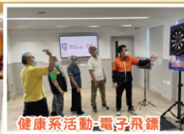
健康系活動-電子飛鏢