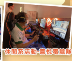
休閒系活動-喜悅電競隊