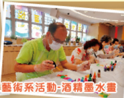
藝術系活動-酒精墨水畫