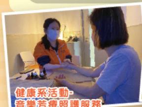
健康系活動-音樂芳療照顧服務