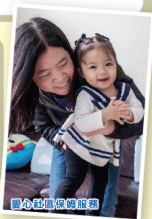
愛心社區保姆服務